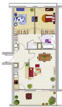
Exemple: T3 - 65,95 m 2 Balcon : 11,4 m 2