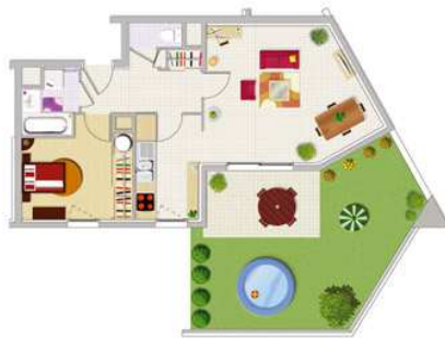
Exemple: T2 - 48,80 m 2 Terrasse : 7,5 m 2 Jardin privatif : 25 m 2